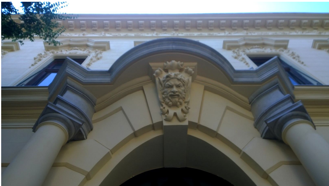
Uličná fasáda paláca detail nad vstupnou bránou