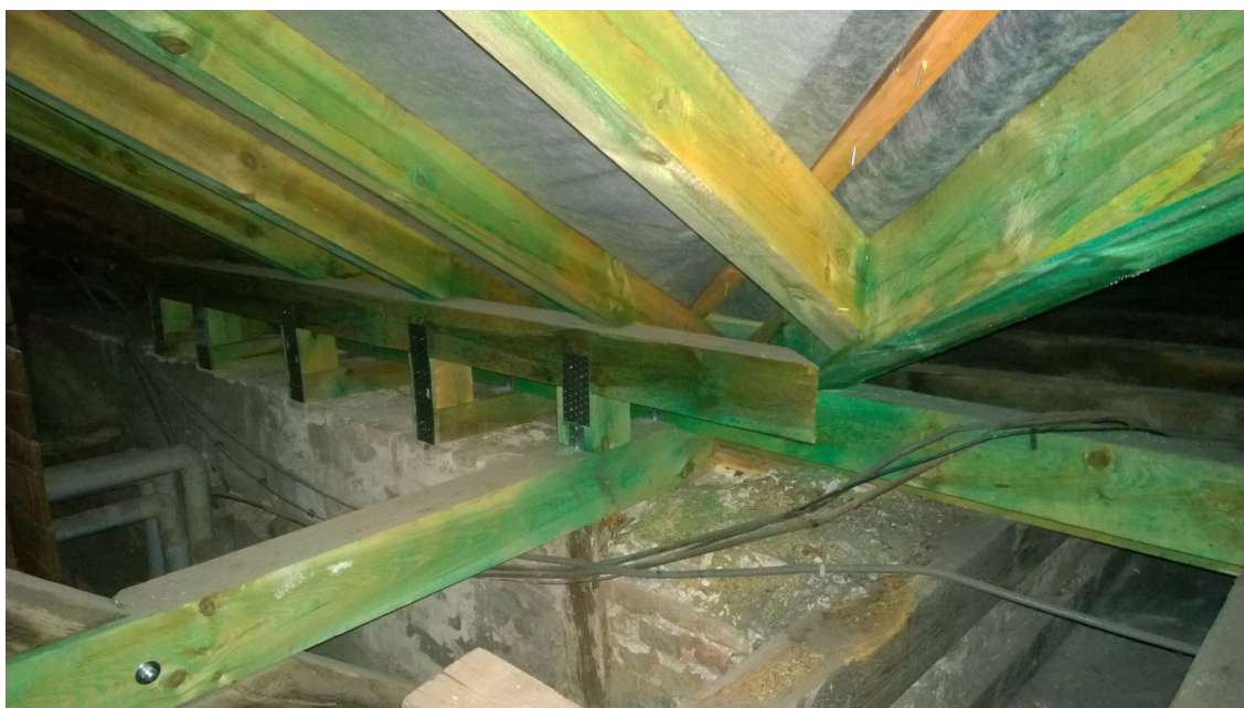
Úprava krovu – detail úžľabia južného krídla paláca