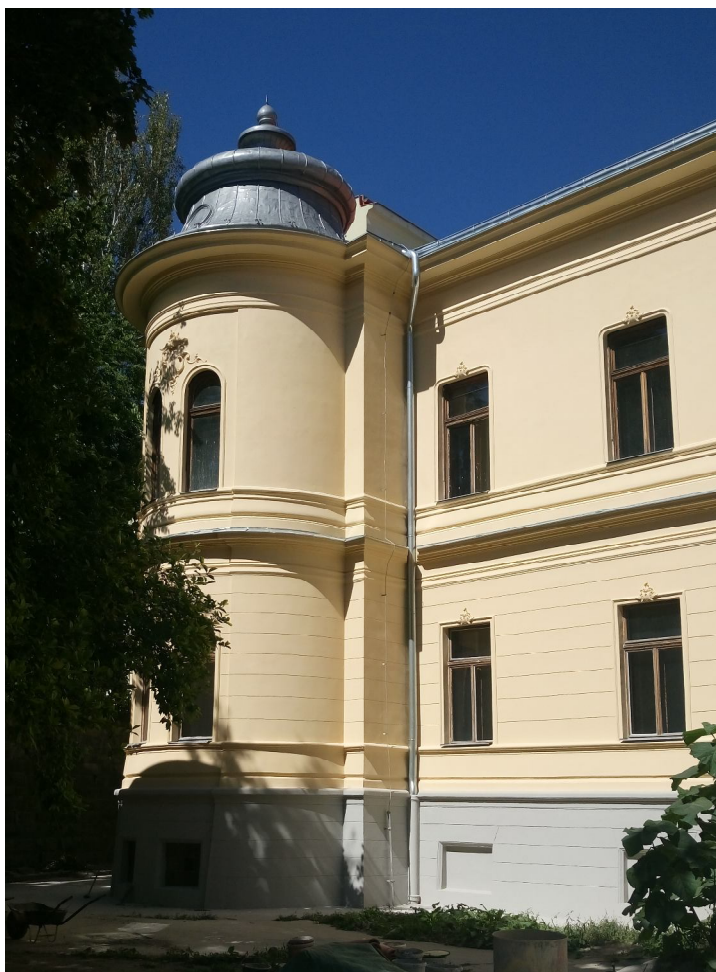
Dvorová fasáda – časť severného krídla paláca