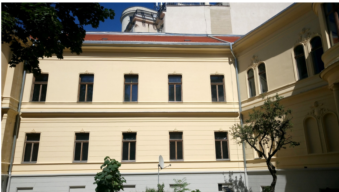
Dvorová fasáda - severné krídlo, časť strechy paláca