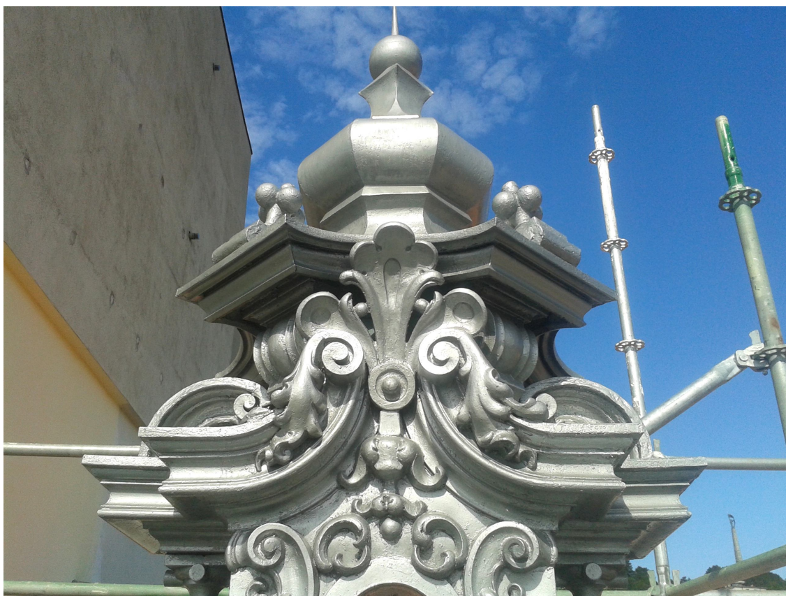
Detaily strešných helmíc po rekonštrukcii