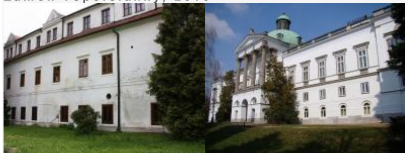
Fasáda Dolná Krupá, 2011