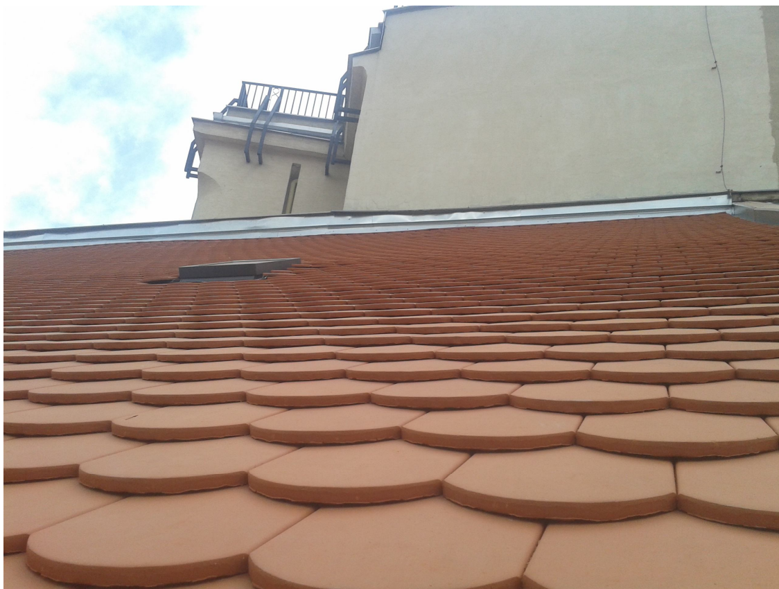
Detail strechy paláca