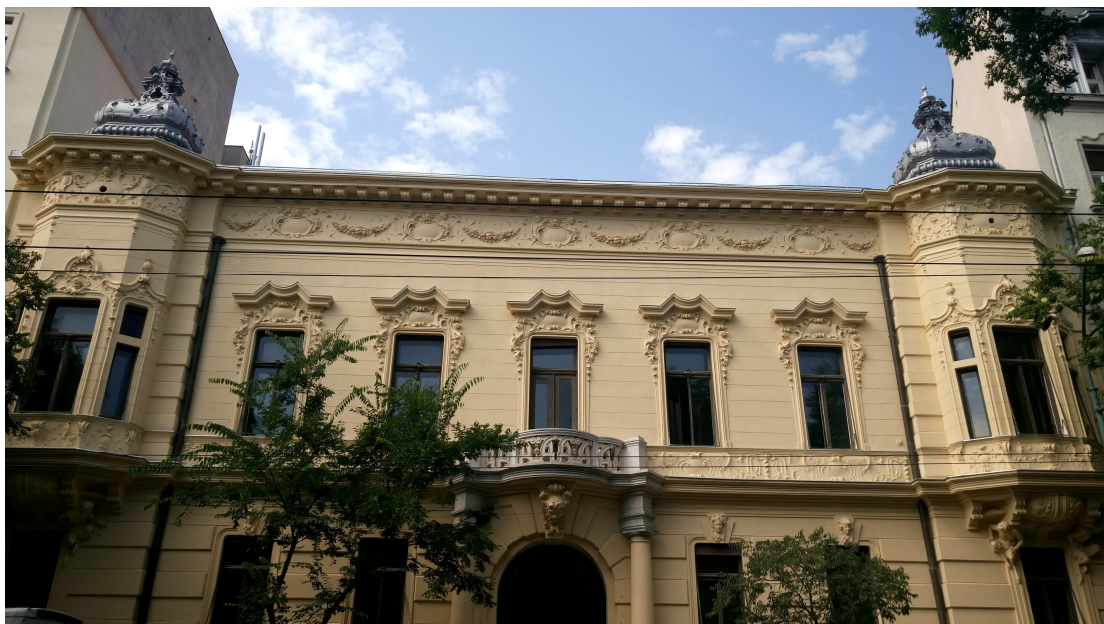
Uličná fasáda paláca