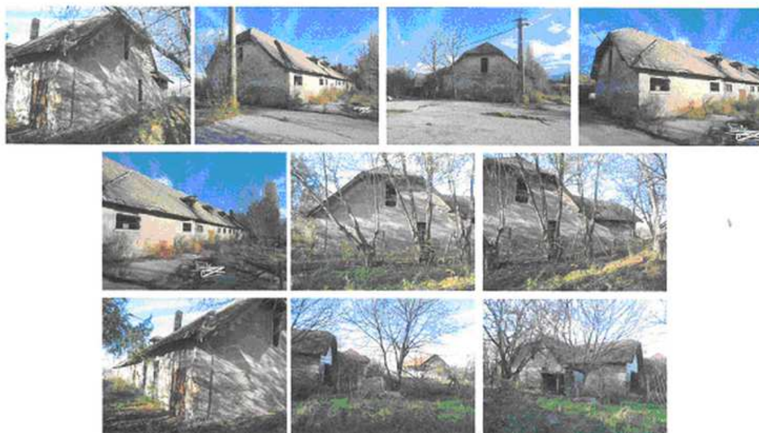
Šopa so súp.č. 131 na p.č. 10782, k.ú. Komárno