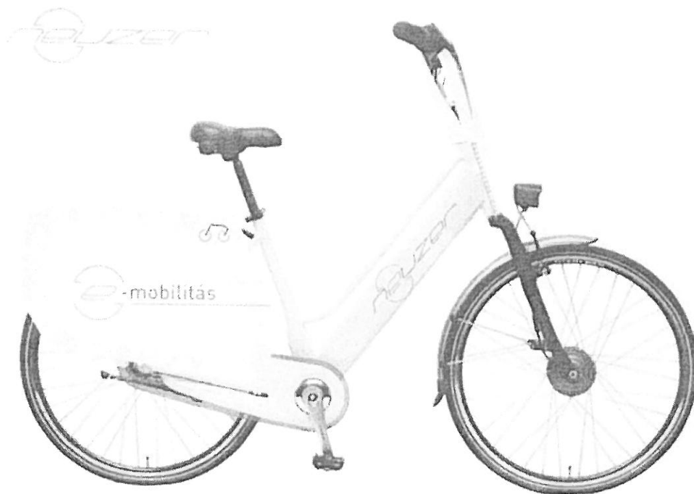
Az elektromos bérkerékpár látványterve