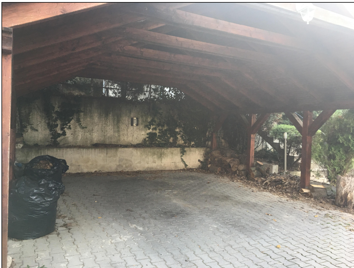
Pohľad na prístrešok na žiadanom pozemku. Za múrom