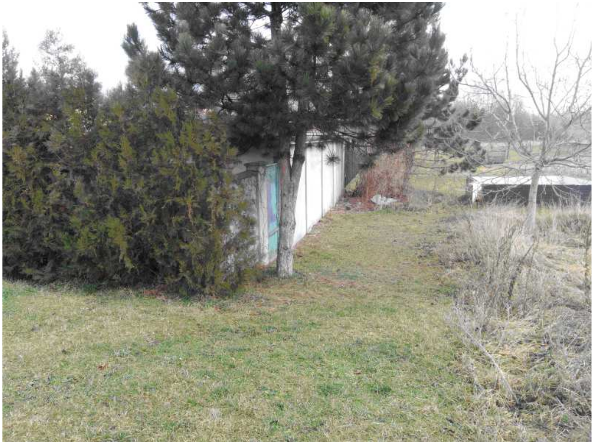
Darányiho – Google Térkép