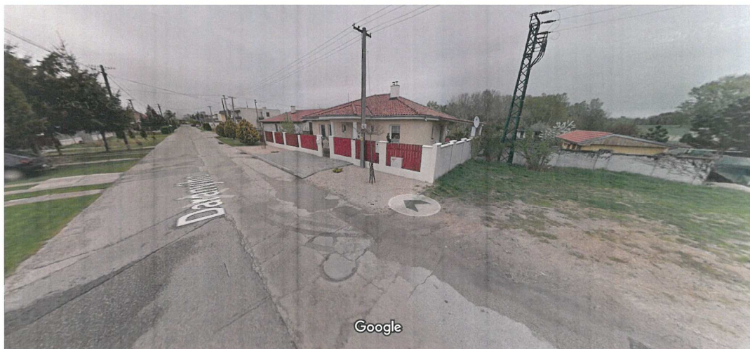
Komárom, Nyitrai kerület