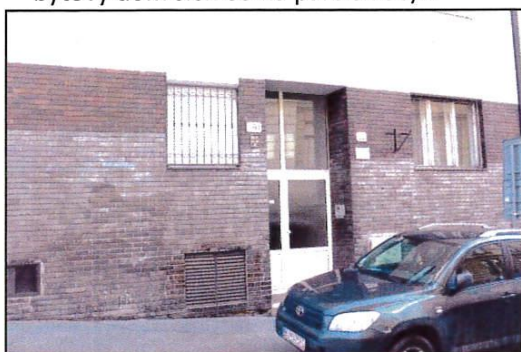
vchod domu-Zochova 22