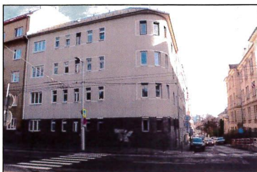
bytový dom s.č.763 na parc.č.756/3