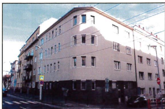
bytový dom s.č.763